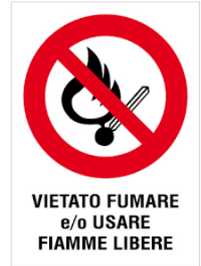
VIETATO FUMARE e/o USARE FIAMME LIBERE

L'incendio è la combustione (reazione chimica di un combustibile con un comburente in presenza di innesco) sufficientemente rapida e non controllata che può svilupparsi senza limitazioni nello spazio e nel tempo. Il rischio di incendio è sempre presente in qualsiasi attività lavorativa.