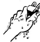
NO MANI BAGNATE